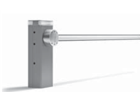
BAR automatická závora s délkou ramene do 9 m