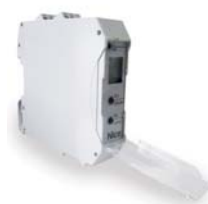
LP1 / LP2 zemní 1-smyčkový / 2-smyčkový indukční detektor vozidel