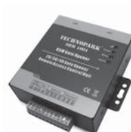
SBM1001 ovládání vzdáleného přístupu s GSM modulem pro 999 telefonních čísel