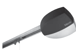
SPIN stropní garážový pohon s řemenovou dráhou do 17,5 m 2