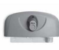
HYPPO pohon pro otočné brány se silnými pilíři a skládací vrata