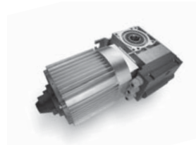
TOM pohon pro průmyslová sekční a rolovací vrata do 750 kg