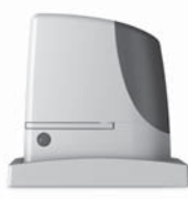
RUN pohon pro posuvné brány do 2500 kg