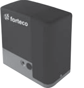
FORTECO pohon pro posuvné brány do 1800 / 2200 / 2500 kg