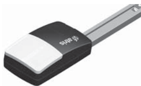
FOX ATRIS stropní pohon pro garážová vrata do 15 m 2