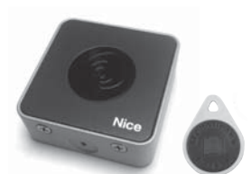
ETP + BC/S snímač bezkontaktních karet a čipů + čip