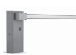
WIDE automatická závora s délkou ramene do 7 m