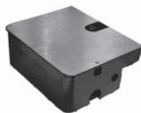
FOX VULCAN podzemní pohon pro křídlové brány do šířky křídla 7 m