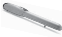
WINGO pohon pro otočné brány do velikosti křídla 1,8 m