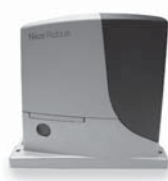
ROBUS pohon pro posuvné brány do 1000 kg