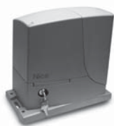
ROX pohon pro posuvné brány do 1000 kg