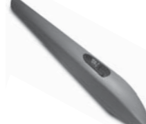
FOX STARK pohon pro křídlové brány do šířky křídla 6 m