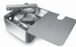
METRO pohon pro otočné brány do velikosti křídla 3,5 m