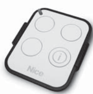
ON3EBD 3 kanálová obousměrná vysílačka 433,92 MHz