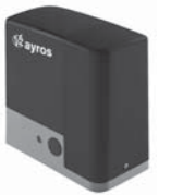
FOX AYROS pohon pro posuvné brány do 1200 kg