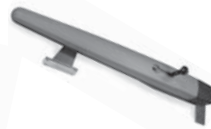
TOONA pohon pro otočné brány do šířky 7 m