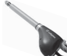
CALYPSO pohon pro křídlové brány do šířky křídla 2,5 / 4 m