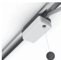
SPY stropní pohon s řemenovou dráhou s pojezdem motoru v dráze do 14 m 2