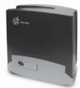
FOX TORQ 500D pohon pro posuvné brány do 500 kg