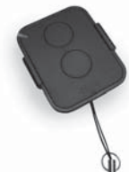
ERA-FLOR 2 kanálový klíčenkový dálkový ovladač s indikací signálu LED diodou, 433,92 MHz