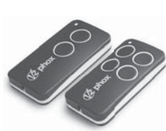
FOX 2; 4-tlačítkový dálkový rádiový ovladač, 433,92 MHz